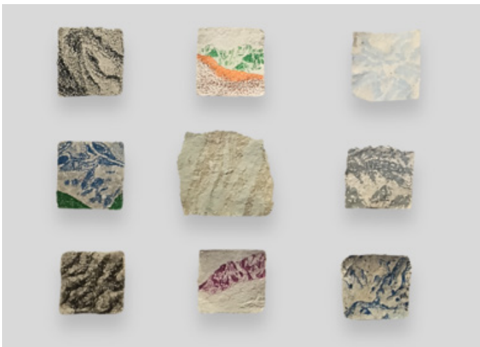
Papier minéral, Léo-Paul Michel-Labat (Ésad) - Papier recyclé, craie, pastel, terre, 2025.

des crêtes qui se cachent les uns les autres, ce qui peut être caractéristique d'un paysage de montagnes. Ainsi, les couleurs changeantes délimitent des «plans» de montagnes rappelant les subtiles différences dans l'écosystème, le paysage et la culture d'une vallée à une autre. Les plans de plus en plus dissimulés au fur et à mesure que le regard monte vers les sommets les plus hauts, sont une manière pour moi de donner envie d'explorer ce que l'on ne parvient pas à observer depuis un point de vue fixe, de retrouver les sensations de découverte des terras incognitas en même temps que de rendre palpable la distance qui nous sépare de l'horizon. »