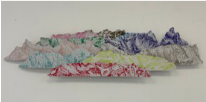
Frêle démiurgie, Léo-Paul Michel-Labat. Papier recyclé, craie, pastel, terre 2025