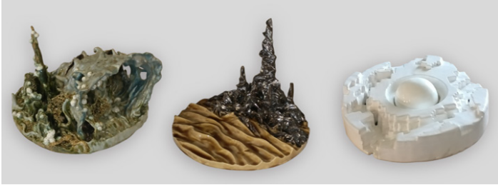
Fukai, Krypton et Arrakis, Jules Souillard. Faïence émaillée Série Franz Schrader dans l'espace.