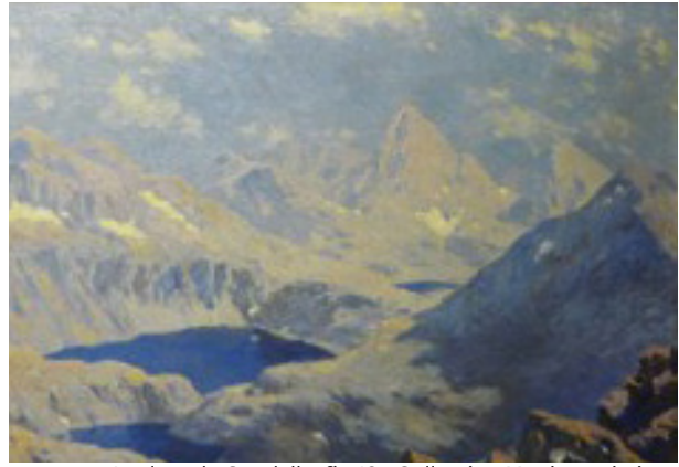
Les lacs de Capdella, fin 19 e.

« Montez au Piméné par un beau jour, attendez-y quatre ou cinq heures de l'après-midi, et quand, par-dessus la frontière déjà sombre, vous verrez le Cotiella briller de son éclat fauve, si haut et si loin, il vous viendra un désir intense de vous en approcher, comme si cette lumière qui le revêt pouvait se respirer ou se boire. » Franz Schrader, Pyrénées, 1877.