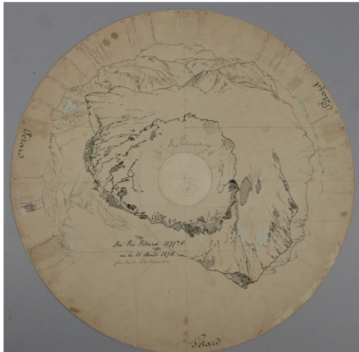
Tour d'horizon, Pic Pétard, 11 août 1878. Don de Luc Chardronnet

Chef-d'œuvre publié en 1914 avec courbes de niveau, la carte du Massif de Gavarnie et du Mont-Perdu au 1 : 20 000 est imprimée en trois couleurs pour marquer la profondeur de champ. La précision du modelé atteint un niveau extraordinaire, aux frontières de l'art et de la science, bien que Franz Schrader commence à souffrir de la cataracte.