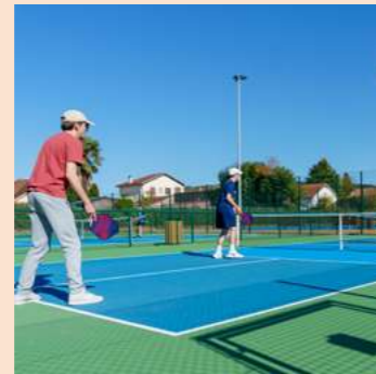
TENNIS & PICKLEBALL