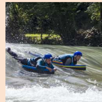
ACTIVITÉS À SENSATION