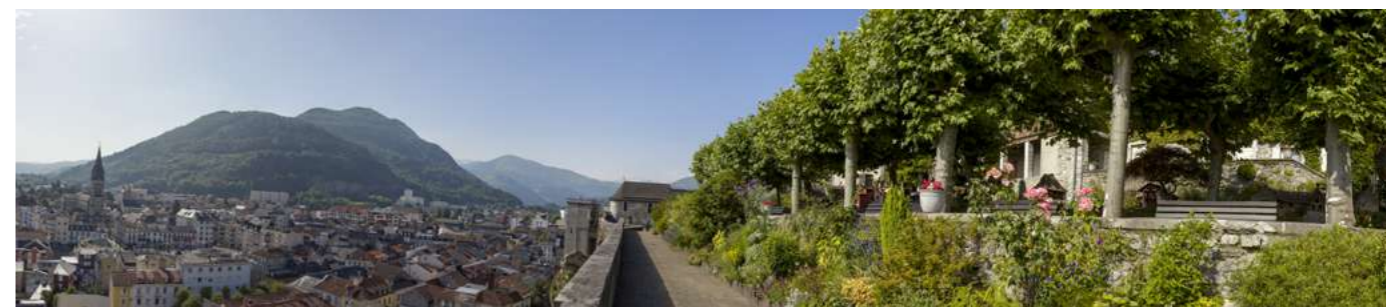
La Ville de Lourdes se mobilise en créant un Centre de Santé pour proposer une nouvelle offre complémentaire aux professionnels de santé, et une solution pérenne pour les habitants.