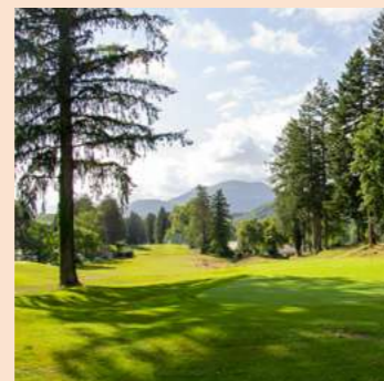
PITCH & PUTT