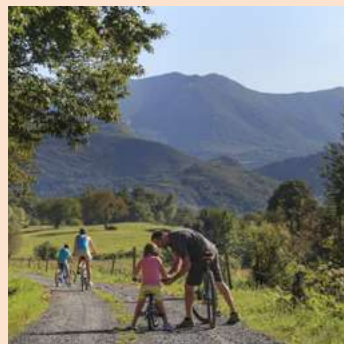
BALADES & RANDONNÉES