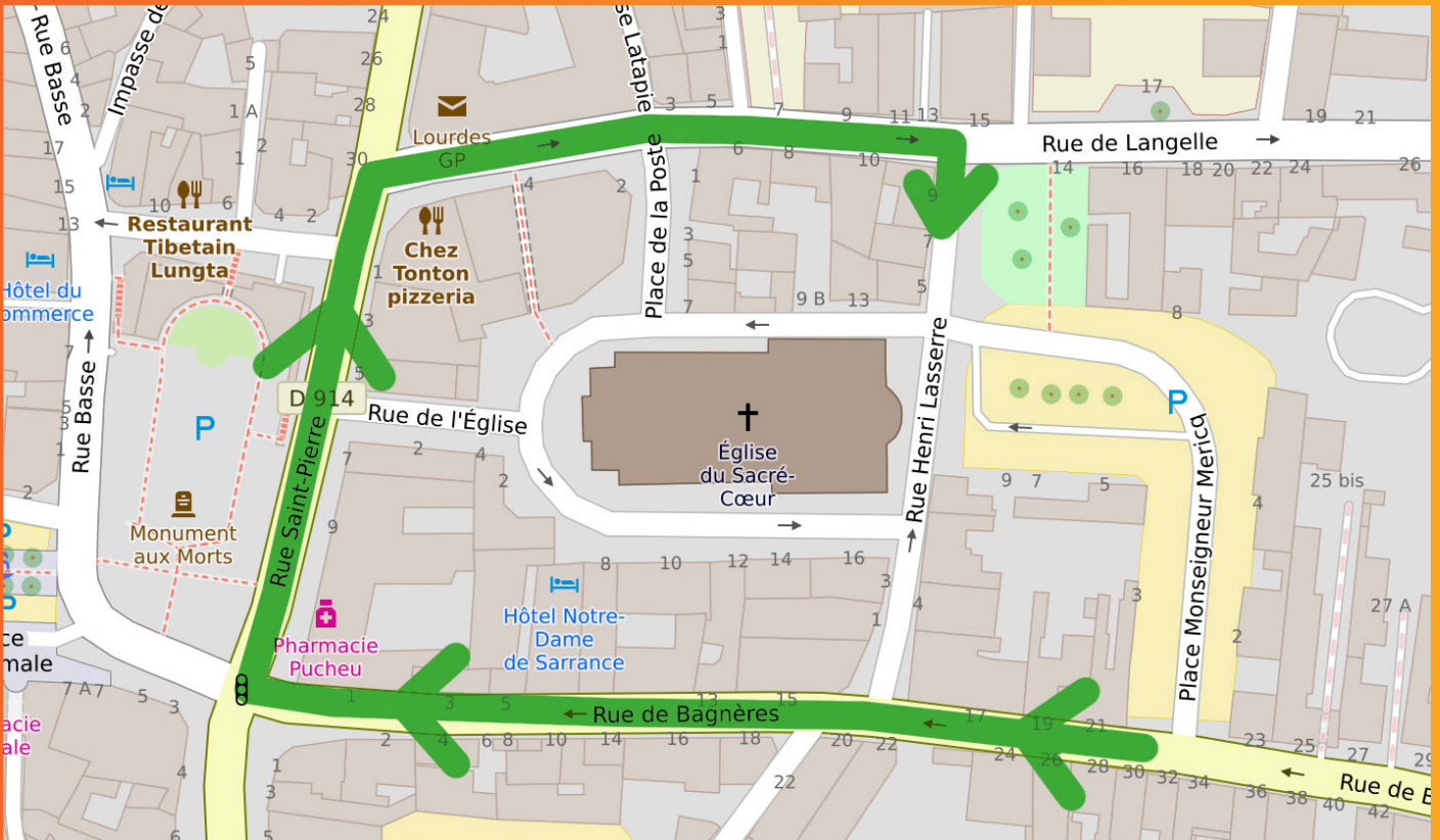
Déviation les 27 et 28 juin